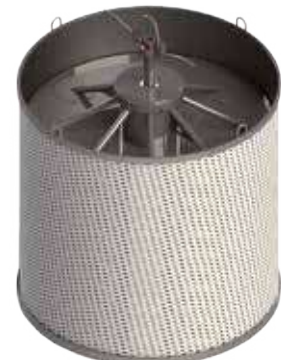
Carrier for loose fibers