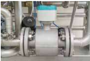
FLOW METER (AUTOMATIC FLOW CONTROL)