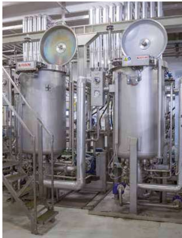
300 PKGS AUTOMATIC LOAD/UNLOAD