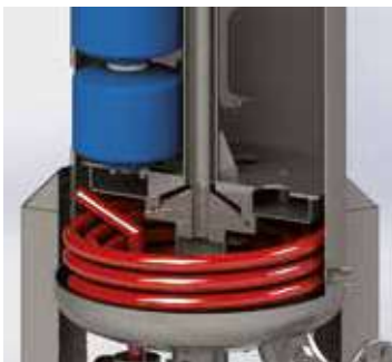
INTERNAL HEAT EXCHANGER: MORE EFFICIENT AND MAINTENANCE FREE.