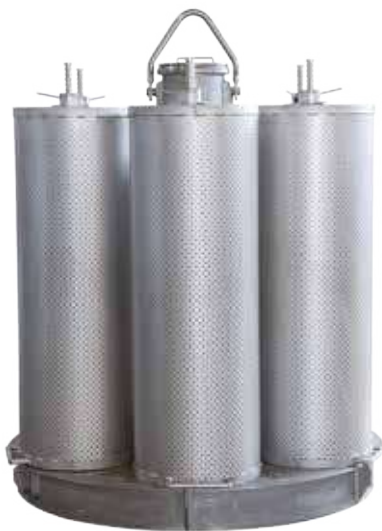
Carrier for tops