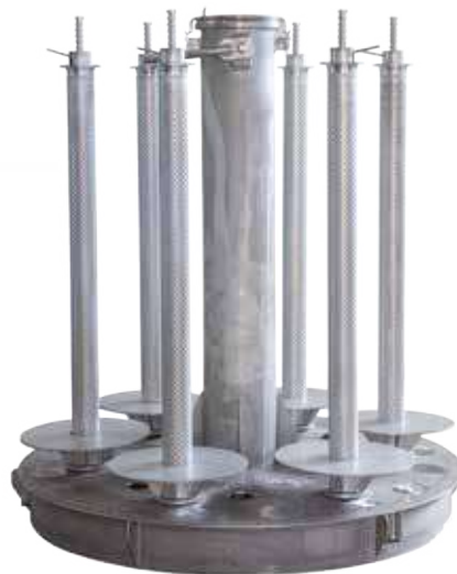
Carrier for beams