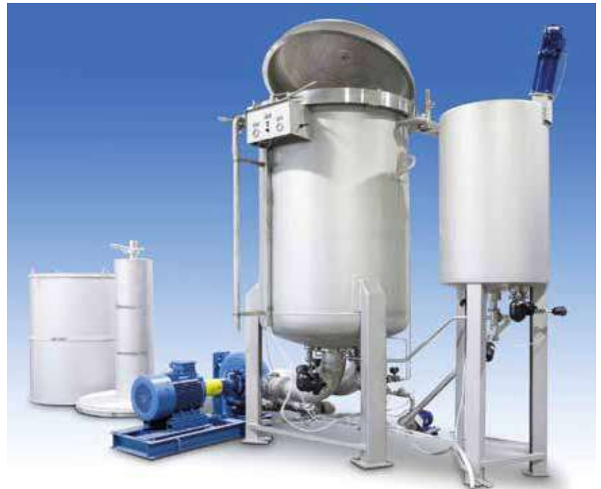
GSE 800 KG