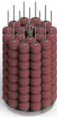
Carrier for packages